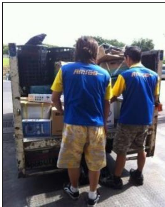
東源物流：協助磁磚搬運