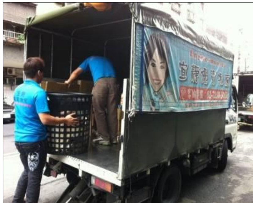
宜靜優質搬家：協助衛浴設備搬運